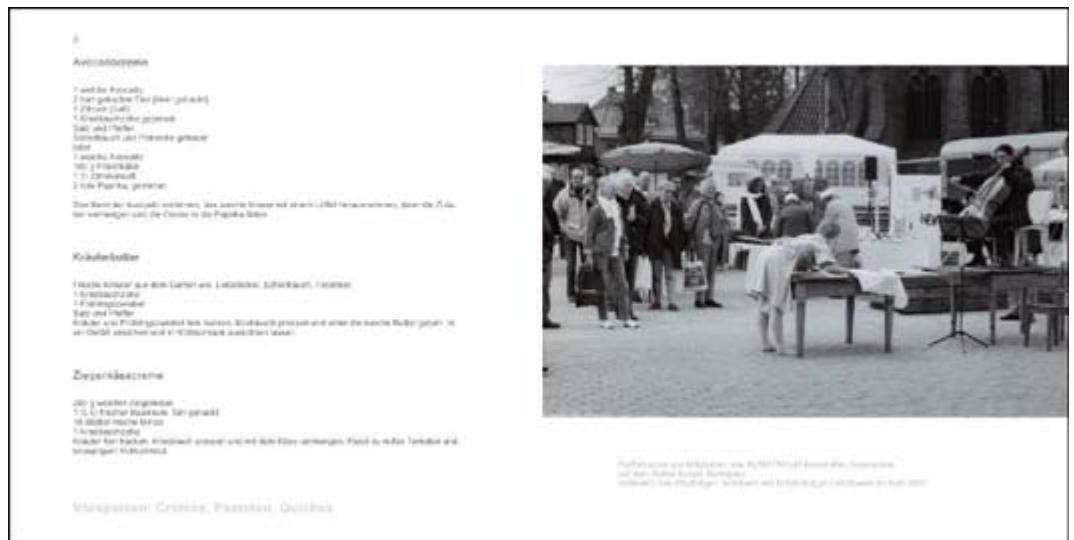
Seite 8 und 9 des Dahlenburger Kochbuches

Auf hundert Seiten findet man Rezepte der Region oder der Veranstaltungsbuffets. Besonders reizvoll die Verbindung mit vielen Bildern der Landschaften um Dahlenburg und der hiesigen Kulturveranstaltungen. Buchformat: 24 x 24 cm Der Preis für das Kochbuch beträgt 15 Euro zuzüglich 4 Euro für Versandt. Zu bestellen bei: Kunstraum Tosterglope Im Alten Dorfe 7 21371 Tosterglope mit einer Bankeinzugsermächtigung.