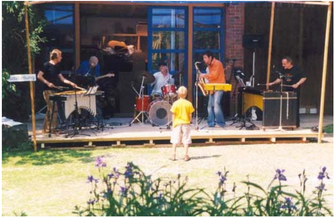
Giff mi Feiff leif am 8.6.2003